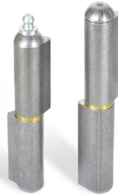
Tipo ST / STS / MS